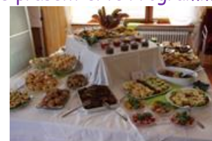
Laut einem Bericht von Gabi Reich